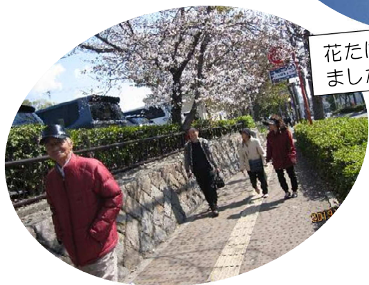
花たばから皆で歩いて行きました。いい気持ちです！