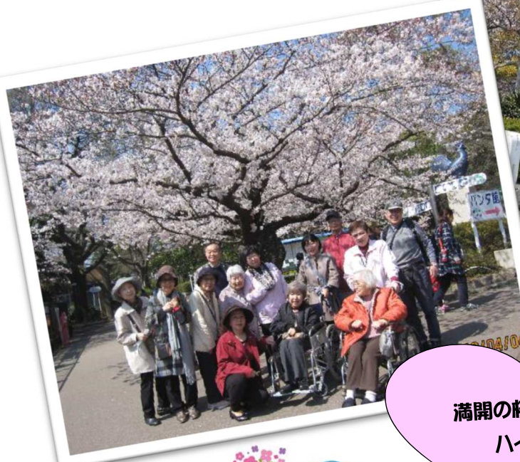
満開の桜の下 ハイ、ポーズ！